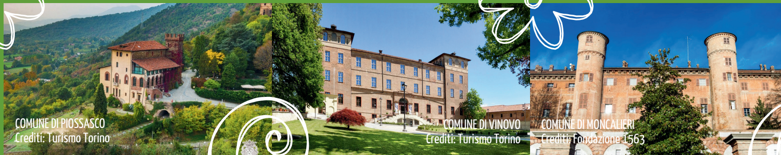
COMUNE DI PIOSASCO

UN NUOVO APPROCCIO ALL'ECONOMIA CIRCOLARE, PER RENDERE ANCORA PIÙ BELLE E PULITE LE NOSTRE CITTÀ!