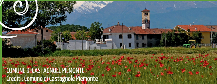
COMUNE DI CASTAGNOLE PIEMONTE