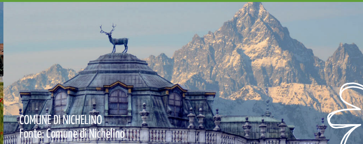
COMUNE DI NICHELINO