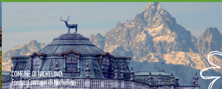
COMUNE DI NICHELINO