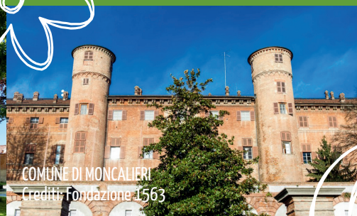
COMUNE DI MONCALIERI Crediti: Fondazione 1563