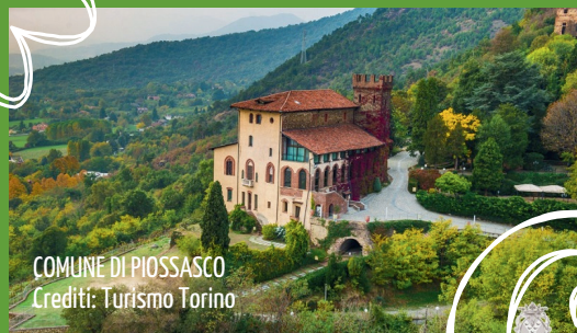
COMUNE DI PIOSSASCO

UN NUOVO APPROCCIO ALL'ECONOMIA CIRCOLARE, PER RENDERE ANCORA PIÙ BELLE E PULITE LE NOSTRE CITTÀ!