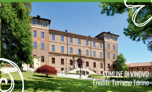
COMUNE DI VINOVO